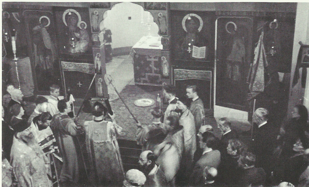
Литургія въ день освященія.